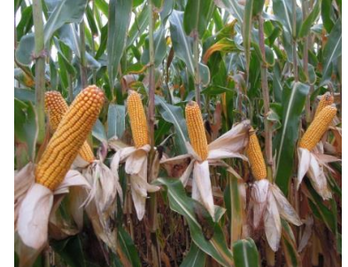
Rezultati Odjela za istraživanje i razvoj u srednjoj Europi 2013, na 11 lokacija