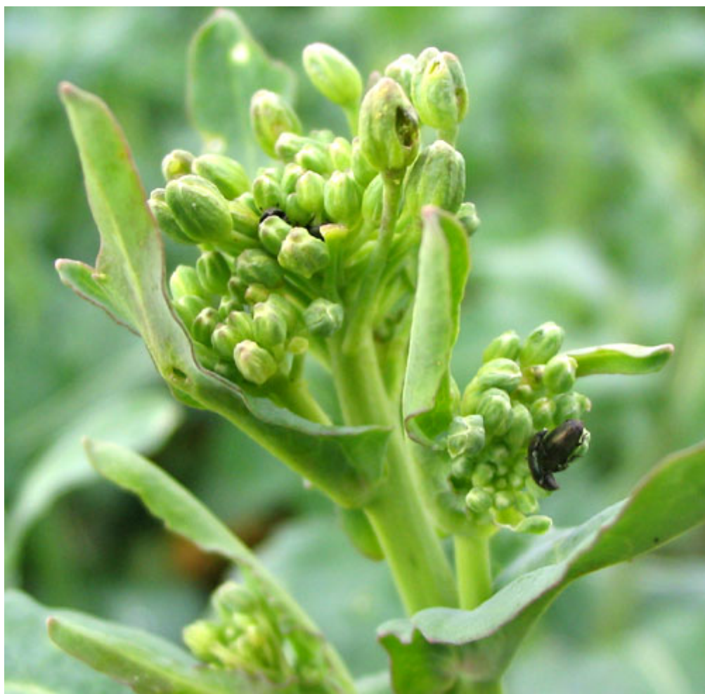
Slika 1. repičin sjajnik