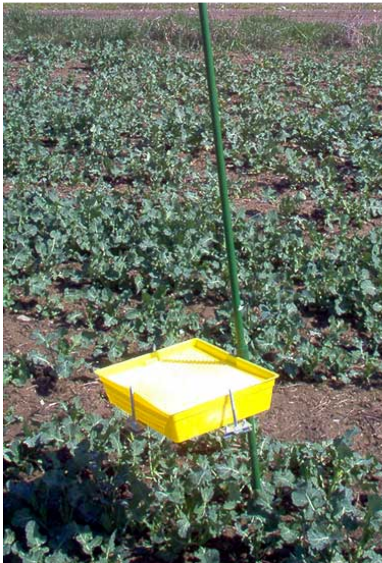
Slika 3. Žute lovne posude

Praćenje štetnika uljane repice moguće je postavljanjem žutih lovnih posuda u usjeve repice (slika 3).